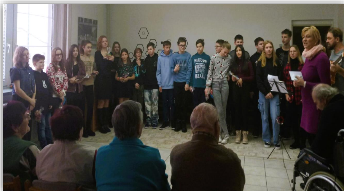
Obr. 6. Vystoupení žáků Masarykovy základní školy Vracov