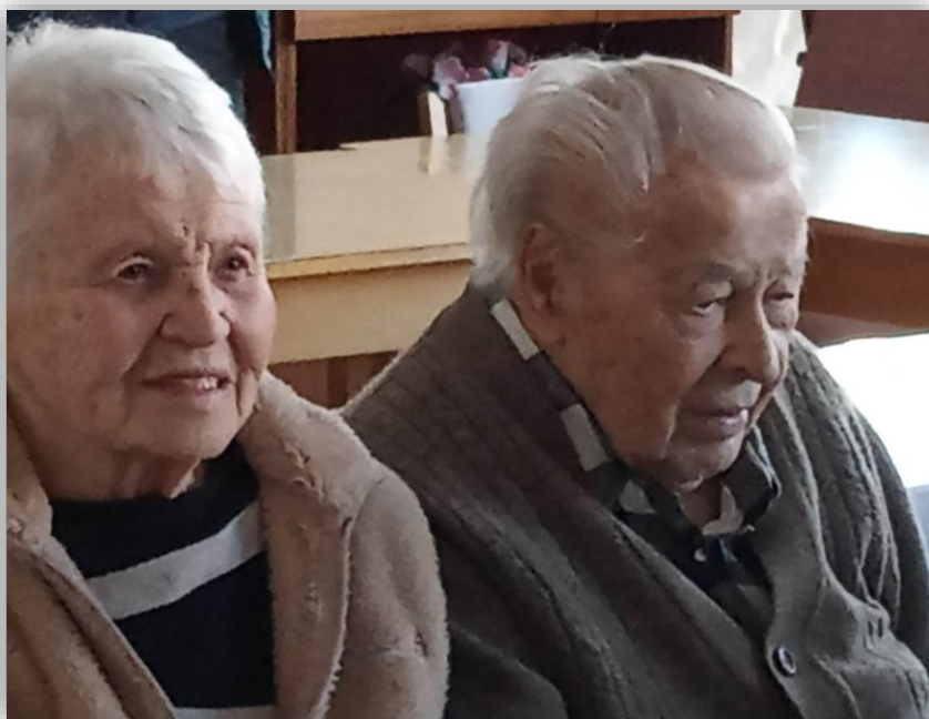
Obr. 1. Obyvatelé DPS

Kde: - v domácím prostředí uživatele – území města Vracova - v prostorách budovy Domu s pečovatelskou službou ve Vracově