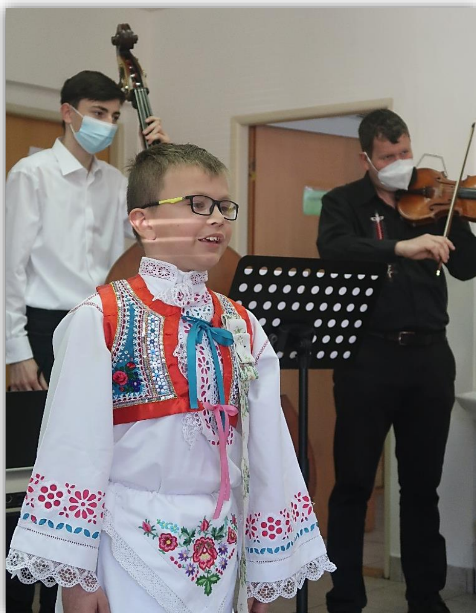
Obr. 4. Vystoupení Cimbálové muziky ZUŠ Vracov