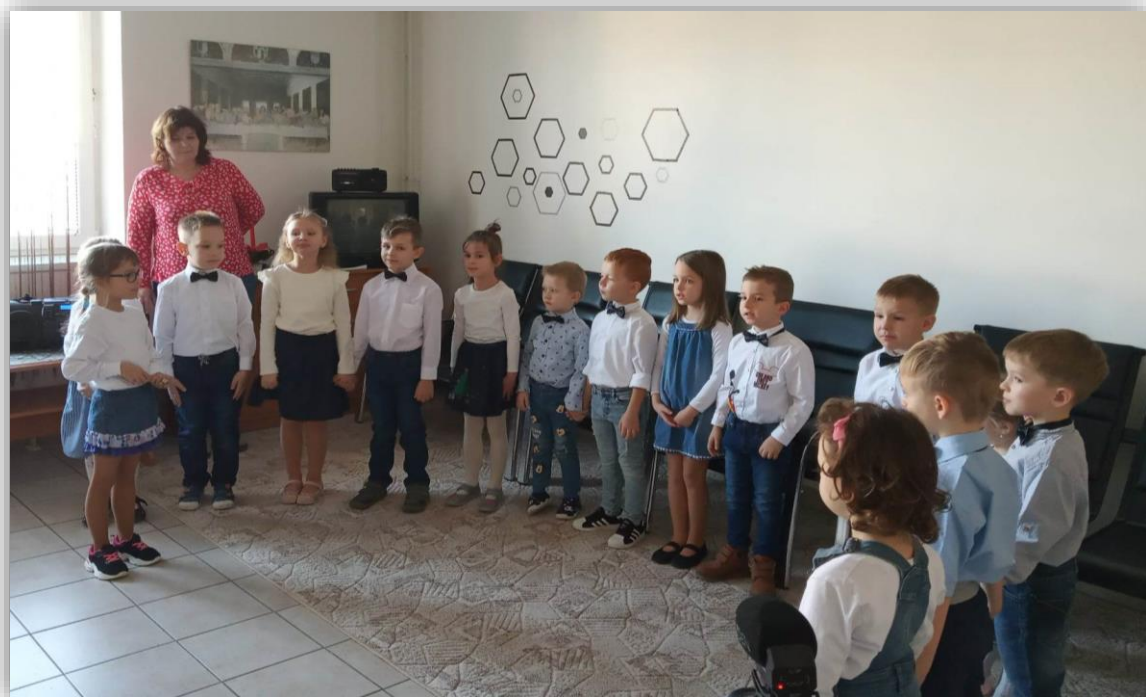
Obr. 5. Vystoupení dětí z Mateřské školy Vracov