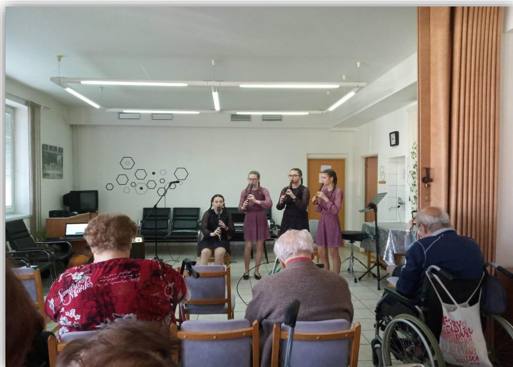
Obr. 7. Vystoupení žáků ZUŠ Vracov