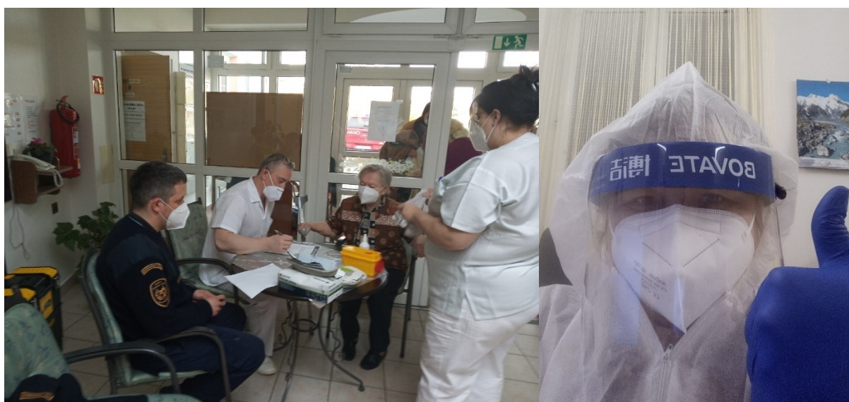
Obr. 4. Očkování obyvatel města Vracova ve spolupráci s mobilním očkovacím týmem a pracovníky KD Vracov

Chtěla bych na tomto místě poděkovat všem, kteří nám pomohli zvládnout nelehký rok 2021. Děkuji za podporu nejen v oblasti finanční, ale i materiální a psychické.