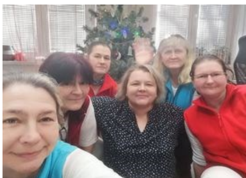
Obr. 2. Pracovní team PS Vracov

Nadále zvyšovat kvalitu poskytování formou vzdělávání pracovníků v PS formou supervizí a vzděláváním zaměřeným nejen na zvyšování odbornosti.