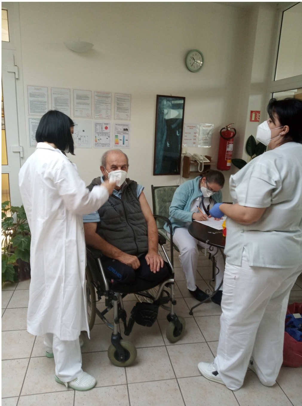
Obr. 3. Očkování obyvatel a pracovníků PS Vracov ve spolupráci s mobilním očkovacím týmem