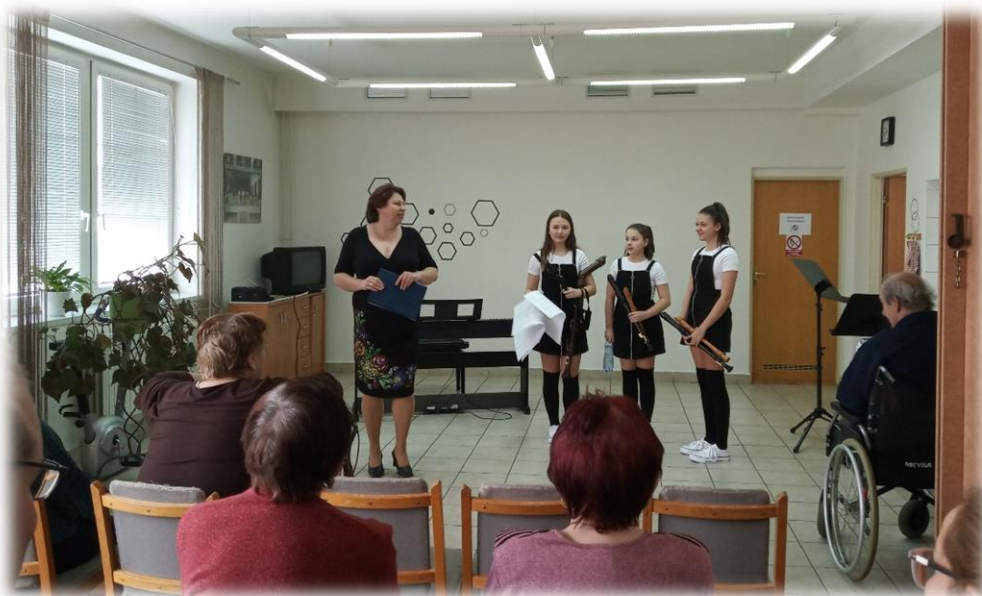
Obr. 3 Vystoupení žáků ZUŠ Vracov