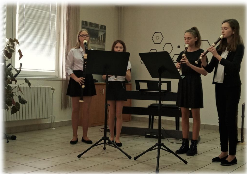
Obr. 4 Vystoupení žáků ZUŠ Vracov k MDŽ