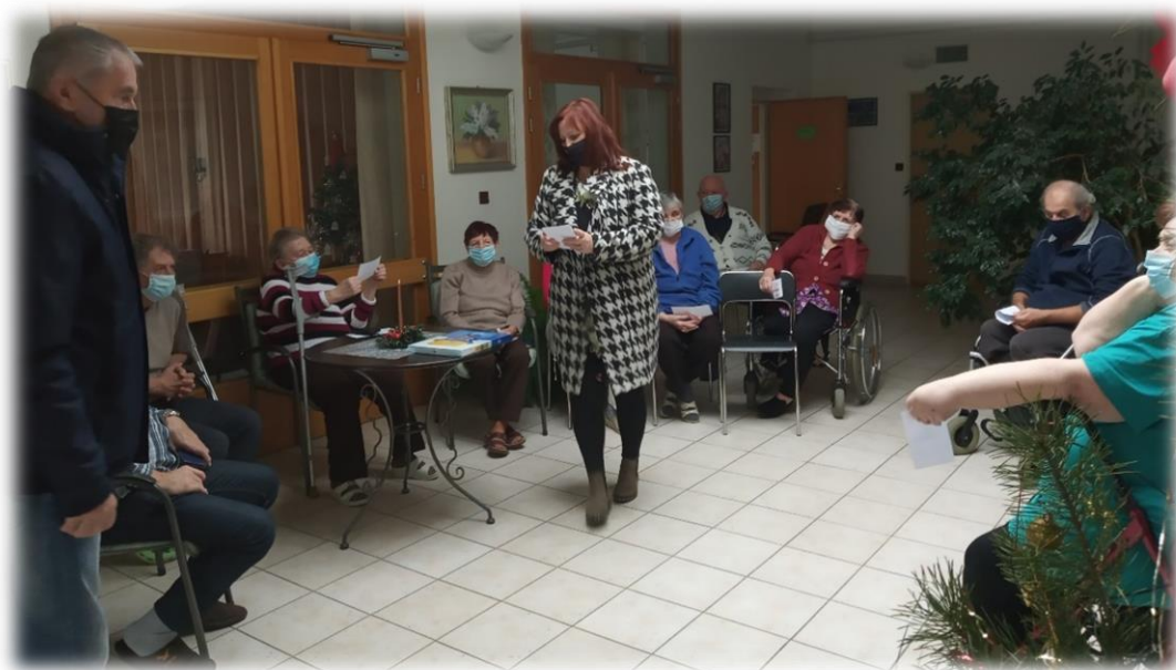
Obr. 2 Vánoce 2020

Nadále zvyšovat kvalitu poskytování formou vzdělávání pracovníků v PS formou supervizí nebo vzděláváním zaměřeným nejen na zvyšování odbornosti.