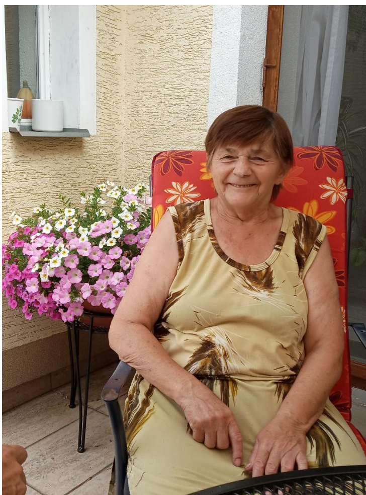
Obr. 1) Fotografie první pečovatelky v historii města Vracova

Kde: - v domácím prostředí uživatelů – město Vracov - v prostorách budovy Domu s pečovatelskou službou Vracov