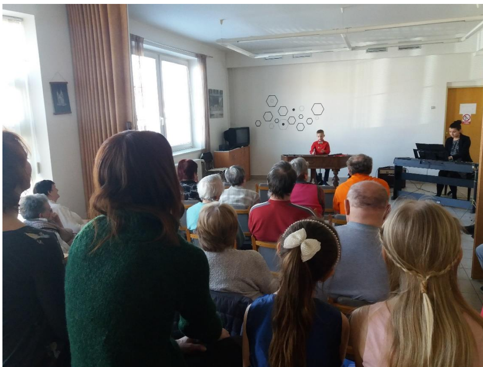
Obr. 4) Koncert dětí ZUŠ Vracov

Homedica Hodonín, Charita Kyjov, praktičtí lékaři, Mateřská škola Vracov, ZUŠ Vracov, Schneer oděvy, sociální pracovnice nemocnice Kyjov, KPSS Kyjov, Úřad práce Kyjov a další.