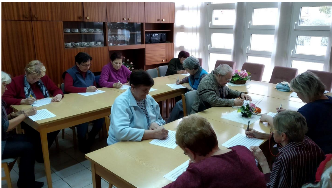
Obr. 3) Kurz Trénování paměti pro obyvatele DPS a veřejnost