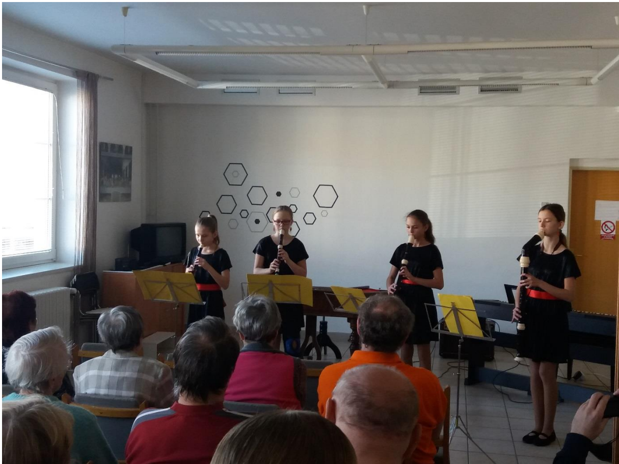
Obr. 3 Koncert dětí ZUŠ Vracov