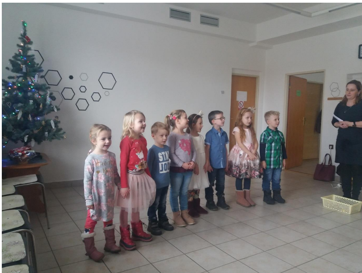
Obr. 2 Vánoční vystoupení dětí MŠ Vracov

Byl zakoupen rotoped pro obyvatele DPS, elektrický zvedák do vany určený k snadnější manipulaci s uživateli při koupání ve Středisku osobní hygieny.