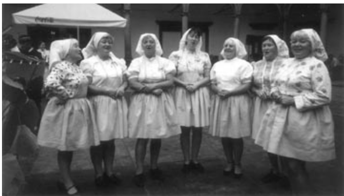
Ženský sbor v Bučovicích na zámeckém nádvoří.