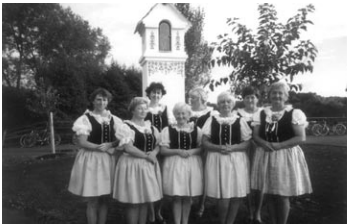
Ženský sbor s mariánským sloupem na Rudníku.