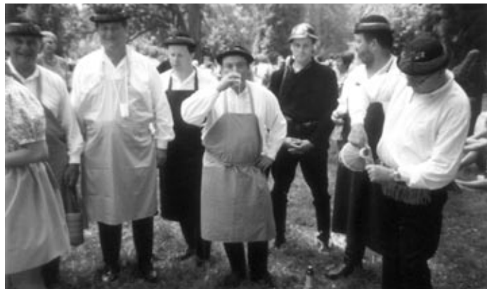
Při nahrávce do rozhlasu na festivalu česneku v Bučovicích.

Největší vytížení pro nás znamenal srpen, protože nás čekal vavřínecký koncert ve Vracově v kostele, který jste možná shlédli, ale také v Bučovicích na zámku