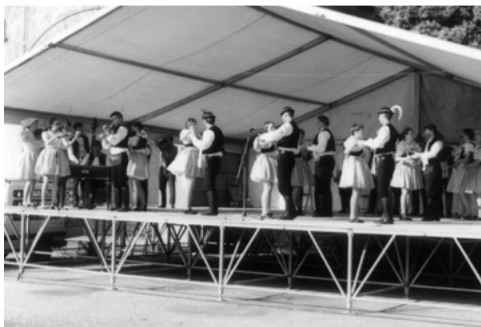
Vystoupení na pódiu v Ó Rosalu (Španělsko).

V srpnu jsme se jako každým rokem zúčastnili festivalu Milotice 2004. Hlavní sobotní večerní pořad byl věnován regrútom u příležitosti skončení branné povinnosti u nás. S velkým úspěchem jsme předvedli období 1. světové války jak v písni, tak i v tanci.