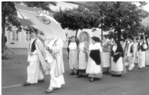
Chorvatský soubor Napredak, který přijel na oplátku k nám.