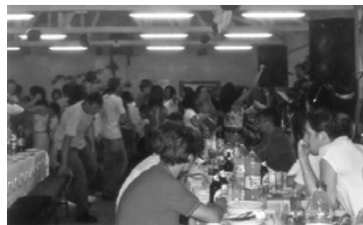
Závěrečná večeře a společná zábava s Chorvaty.