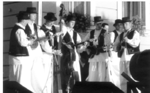
...a muzikanti tohoto souboru, kteří padli do oka některým našim členkám