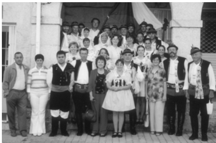
Před festivalovým vystoupením v Tomiňu (Španělsko).

pět souborů. Základem jejich muziky jsou gajdy a velké bubny zvané bombo. My jsme reprezentovali Vracov a Kyjovsko autentickým folklórem, který se líbil pro svou melodičnost a taneční rytmiku. Od vystoupení v přístavním městě Baiona například už známe i pocit, kdy celé hlediště tleská ve stoje. Je to nepopsatelný zážitek. Hostitelé byli více než pozorní a my jim jejich péči chceme vrátit tím, že by-