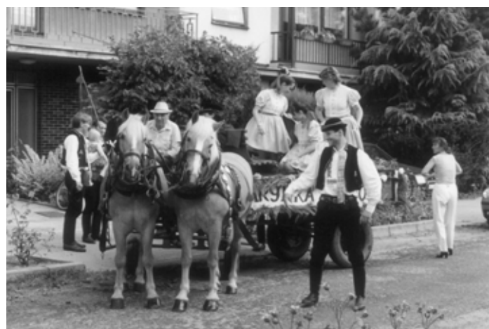
Vyrážíme na poslední „regrútskou jízdu“ do Kyjova.

V domácím prostředí jsme absolvovali dožínky, které jste určitě sledovali a potom vinařské zvyky v nádvoří zámku v Bučovicích.