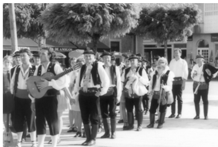
V průvodu ve festivalovém Ó Rosalu (Španělsko).

Vracovské hody pro nás byly nejen prestižní záležitostí, ale hotovým svátkem, protože ženatí stárci manželé Fojtíkovi jsou členy našeho souboru a uměli nás správně vyhecovat.