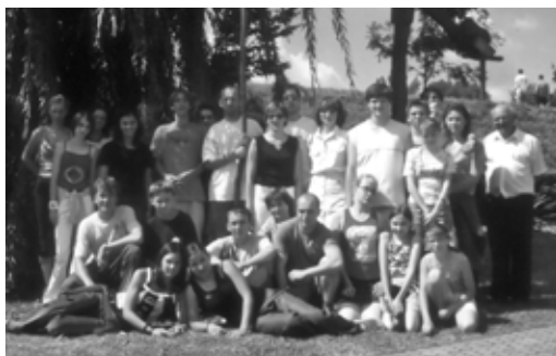
Chorvatsko - Mezinárodní kulturní festival v oblasti Županja

prázdniny mít nebude. „Vždyť bychom to všechno zapomněli!!“ A opravdu i letos jsme měli možnost předvést všechno, co jsme se naučili, a to i na několikadenních festivalech.